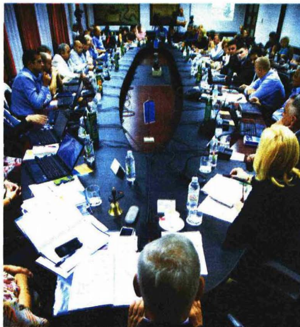
Kandidatura za europsku prijestolnicu kulture neće samo pocijepati kulturni atom nego vjerojatno i Gradsko vijeće

"Kandidatura Splita temelji se na konceptu "Splitting the Cultural Atom", što je potaknulo lančanu reakciju uzduž i poprijeko grada i omogućilo nam