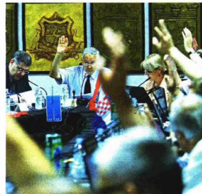
Nedosanjani san predlagača: 'Ruke ćemo skupa, za prijestolnicu dići...'